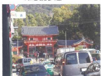
八坂神社祇園交差点