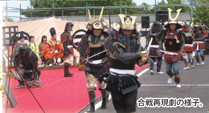
合戦再現劇の様子。