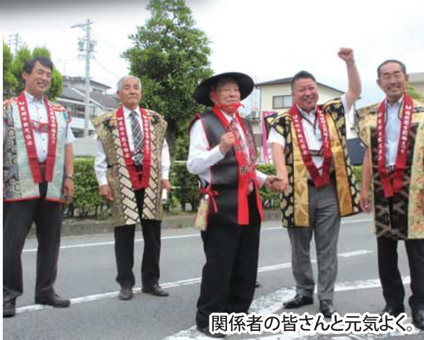
関係者の皆さんと元気よく。