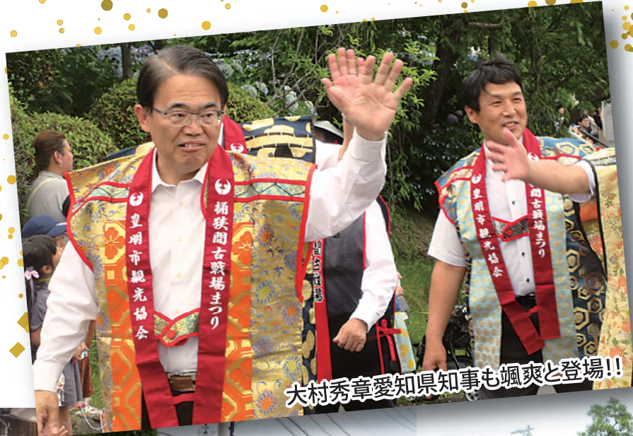
大村秀章愛知県知事も颯爽と登場!!