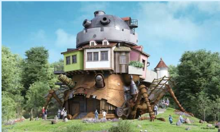
「ハウルの城」イメージ