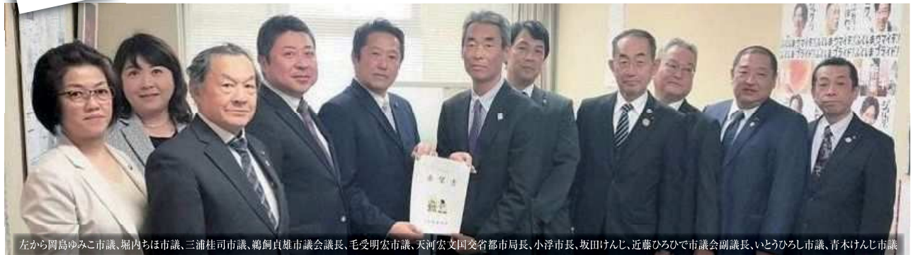
左から岡島ゆみこ市議、堀内ちほ市議、三浦桂司市議、鶴飼貞雄市議会議員、毛受明宏市議、天河宏文国土交省都市局長、小浮市長、坂田けんじ、近藤ひろひで市議会副議長、いとうひろし市議、青木けんじ市議