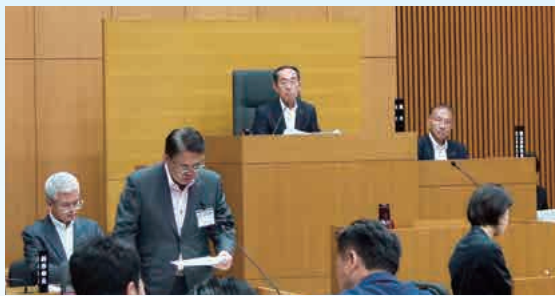
大村知事を迎えるの本会議にて