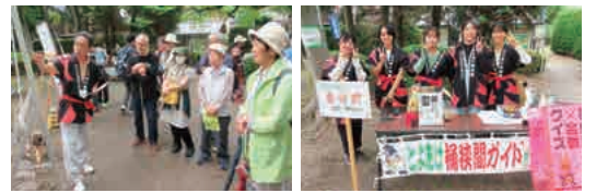
ガイドボランティアの方から熱心に説明を聞いていました。