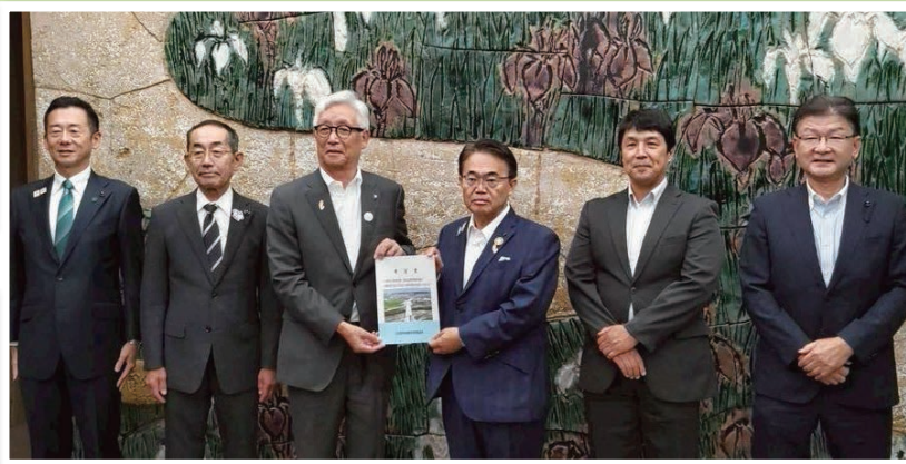
名古屋岡崎線要望活動