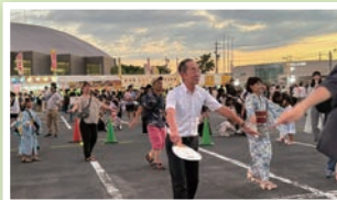
とよあけ夏まつり2025