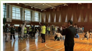
西沓掛区綱引き大会