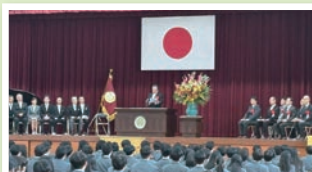
豊明高校創立50周年記念式典