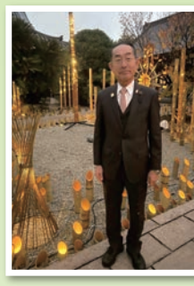
とよあけ千の灯 点灯式