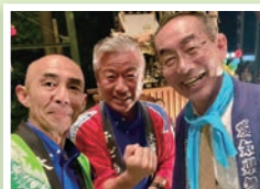
愛知県無形民芸文化財 大脳梯子獅子にて