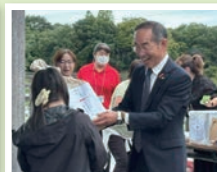
豊明市心身障害者 オリエンテーリング大会