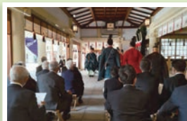
終戦八十年臨時奉幣祭並 秋のみたま祭にて