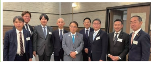
自民党愛知県議団消防・自身防災委員連盟講演会

今回も400枚を超す写真の中から一部を抜粋しました。載らなかった地区、地域、団体のみなさん、ホントにゴメンナサイ。