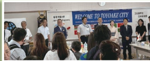
桜花学園留学生ウエルカムパーティー