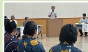
西岩部屋豊明後援会総会