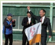
豊老連グラウンドゴルフ 大会坂田杯にて