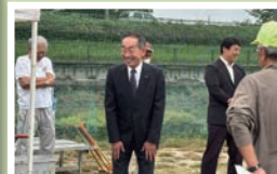
坂部区三代目グラウンドゴルフ大会