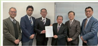
豊明市商工会からの陳情